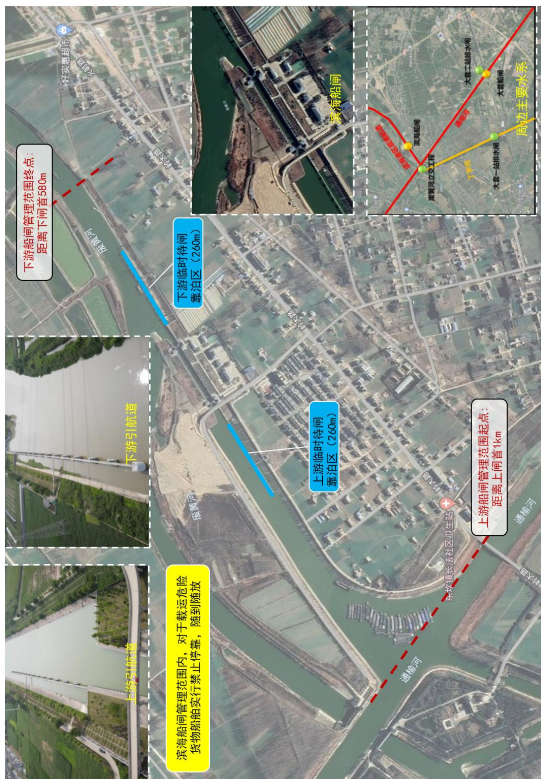
附图 1 滨海船闸闸区管理范围示意图