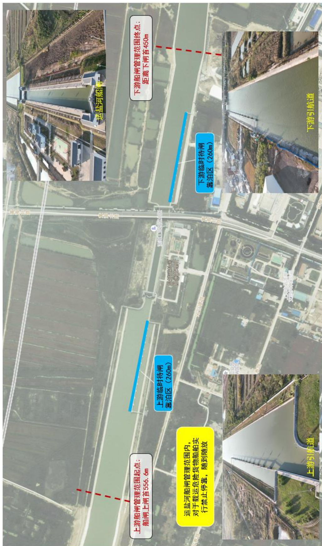
附图 1 运盐河船闸闸区管理范围示意图