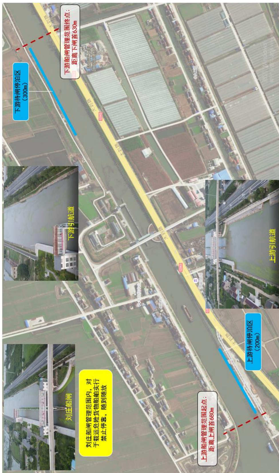
附图 1 刘庄船闸闸区管理范围示意图